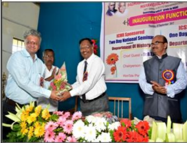
Welcome by Principal