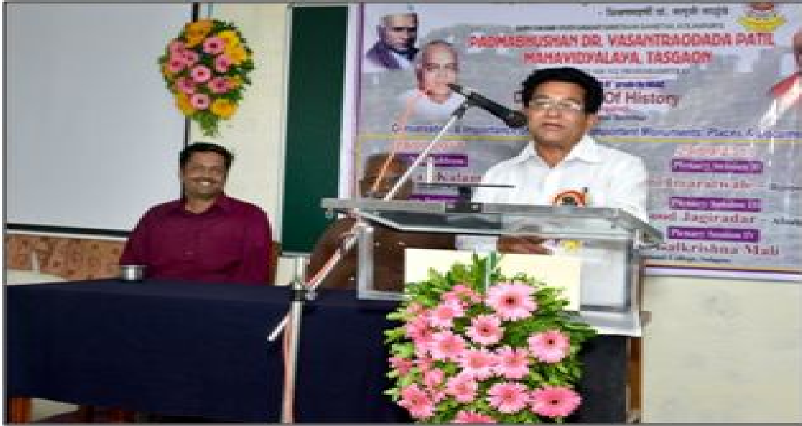
Vote of Thanks by coordinator