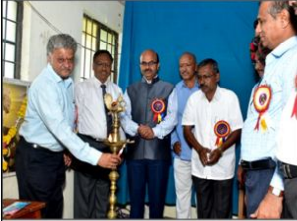
Inauguration by Dignitaries