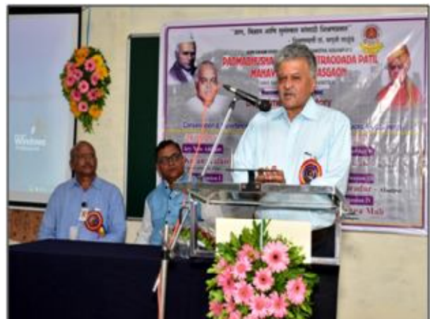
Keynote address by Hon. Kiran Kalamdani