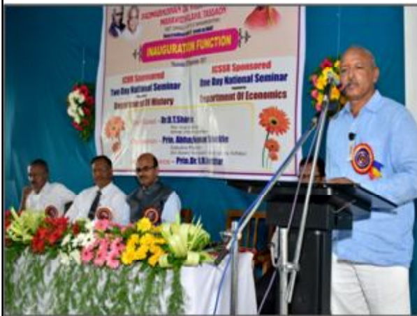
Address by Convener