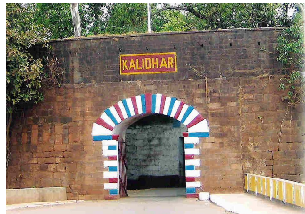
The Main Entrance of the Belgaum Fort facing towards north

The Belgaum fort is about 1000 yards long and 800 yards broad. It is an irregular oval shape of 2900 yards perimeter. It occupies an area of about 100 acres, and over its principal strength to the width of its steep wet ditch and the height of its stone walls. The ditch, at present forty to fifty feet deep and about 72 feet wide.