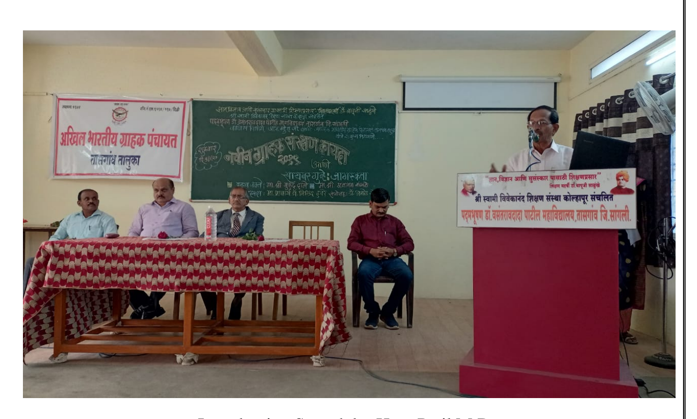
Introduction Speech by Hon. Patil M.D.