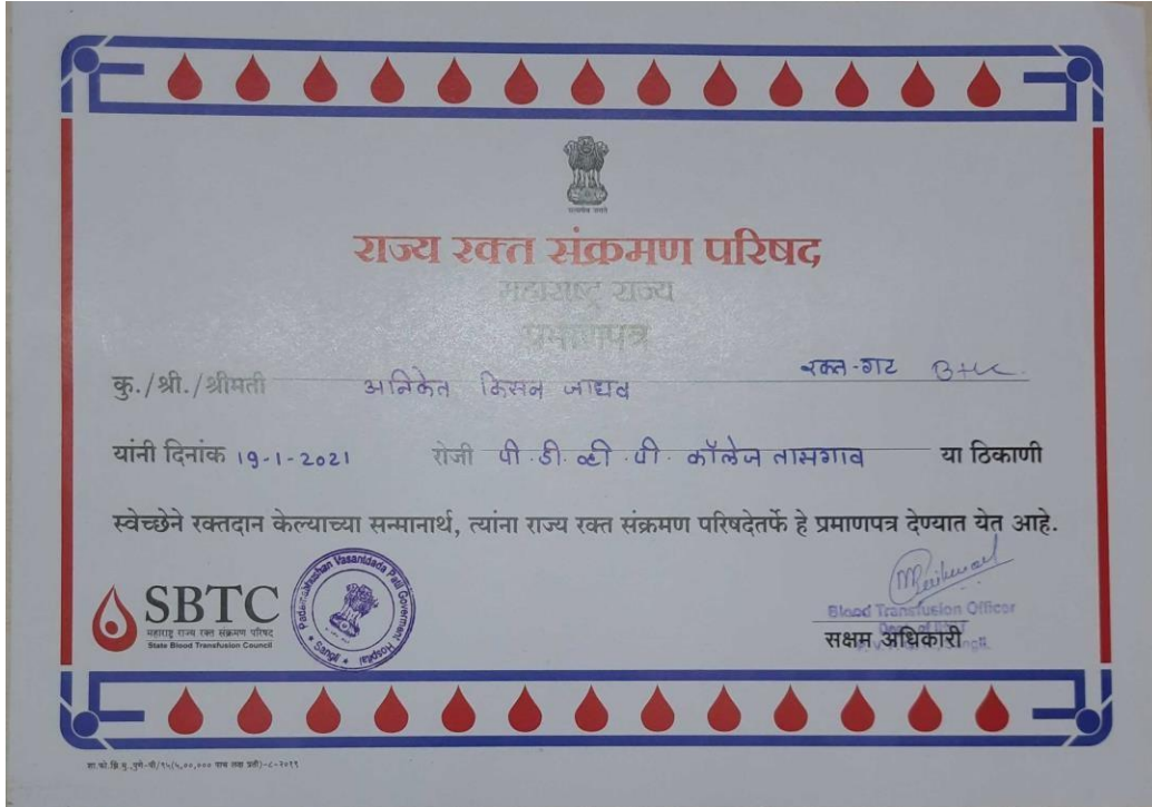
Certificates Provided By Blood Bank to Blood donated Participants