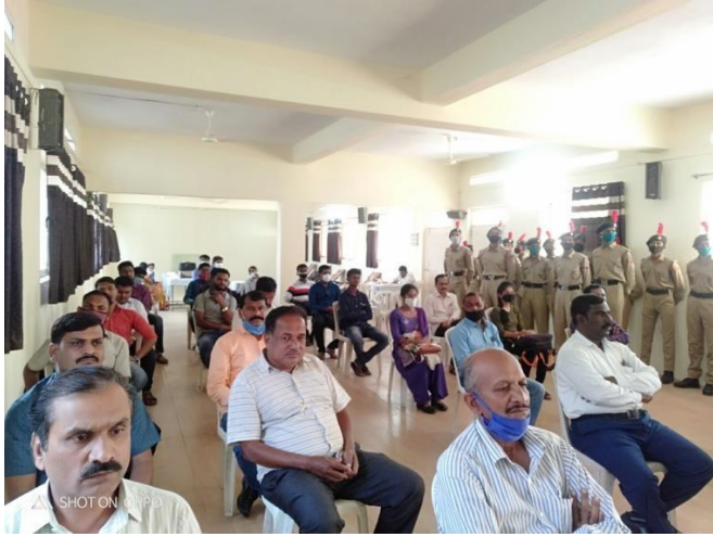
Faculties with students