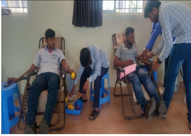
Blood donation by NSS Student