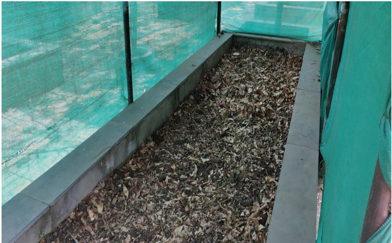
Adding water for maintaining proper humidity.