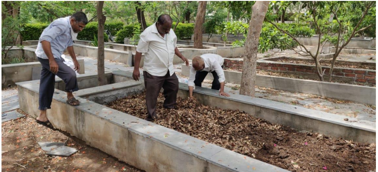
Bed preparation for vermicompost