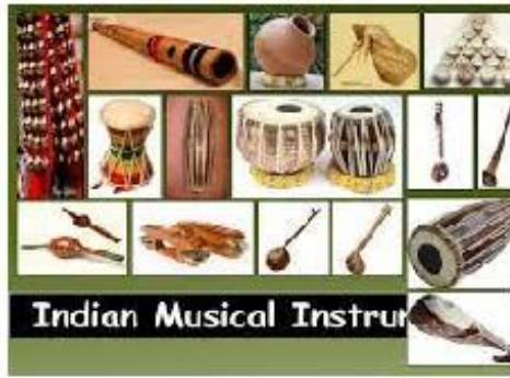
Indian Musical Instrum