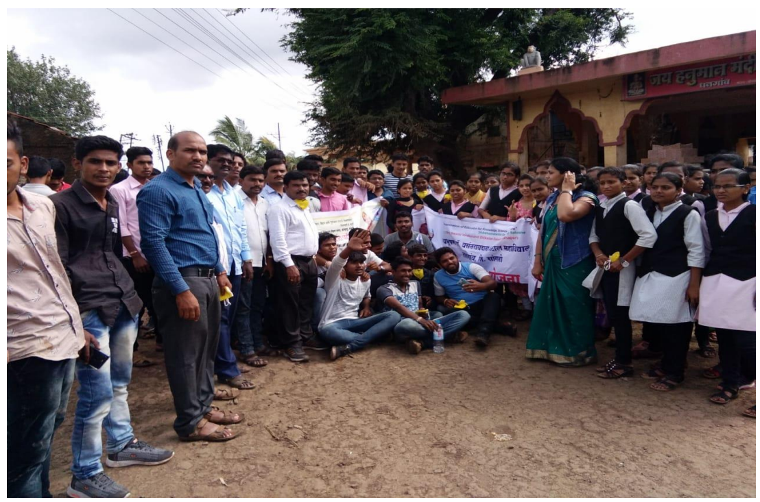
Group Photo of NSS team of Institute and volunteers after cleaning campaign