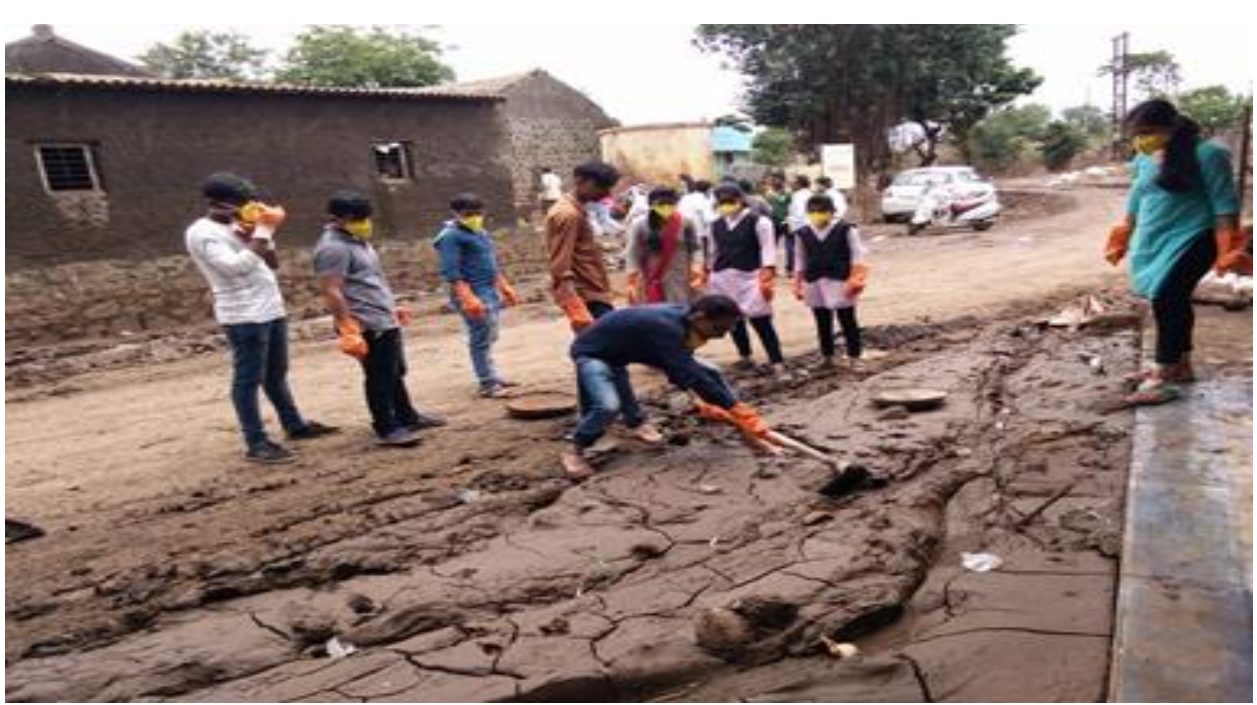
NSS Volunteers cleaned roadside mud