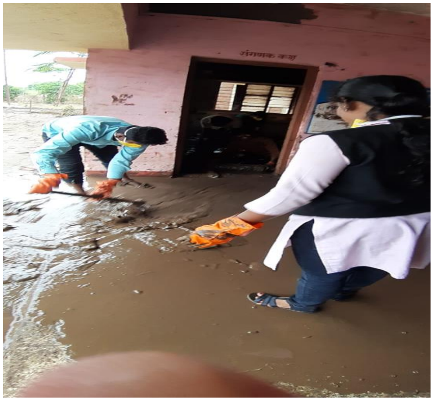
NSS Volunteers Cleaned the School Computer Room