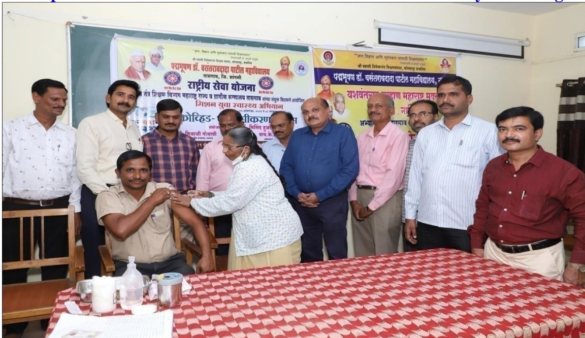
Participant Vaccinated By Sister & Principal With Staff