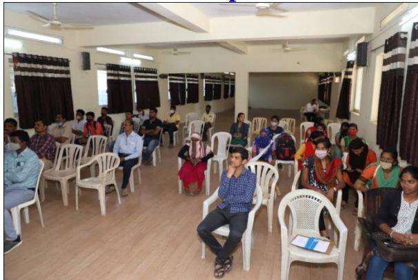
Participants in Welcome Function