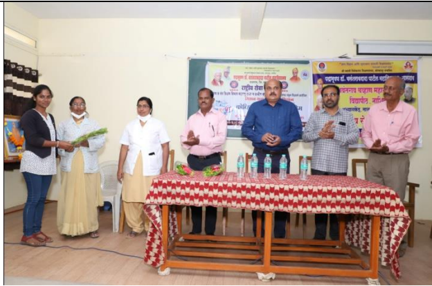
Hospital Staff Felicitated By N. S. S. Students