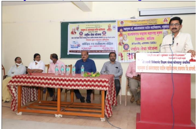
Votes of Thanks By Anna Bagal