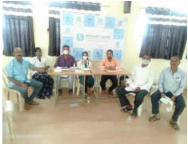
Checking of B. P. and Sugar of Participant by Team of Sevasadan Hospital Miraj with Senior Citizen