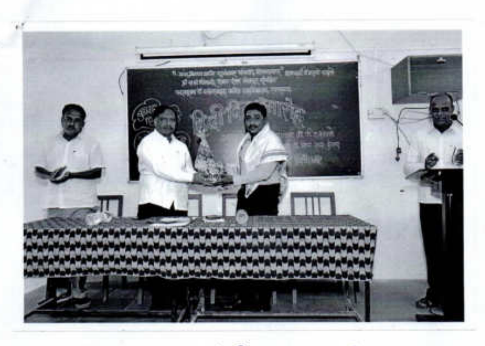
९४ स्टिलम्बर २०६८ हिंही हिन ' त्यमारेहर चुनुरद अतिले का स्वाल