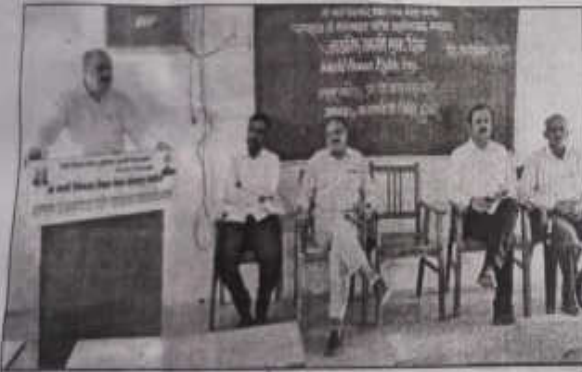
प्रतिष्थनी : वृत्तसेवा

□ तासगाव : जगातील प्रत्येक व्यक्तीचे स्वातंत्र्य अबाधित राहावे त्यांना सन्मानपूर्वक जगता याचे