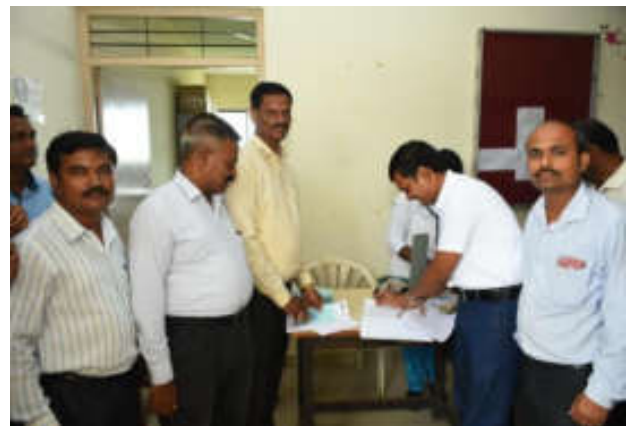
B. P. Checking and Registration