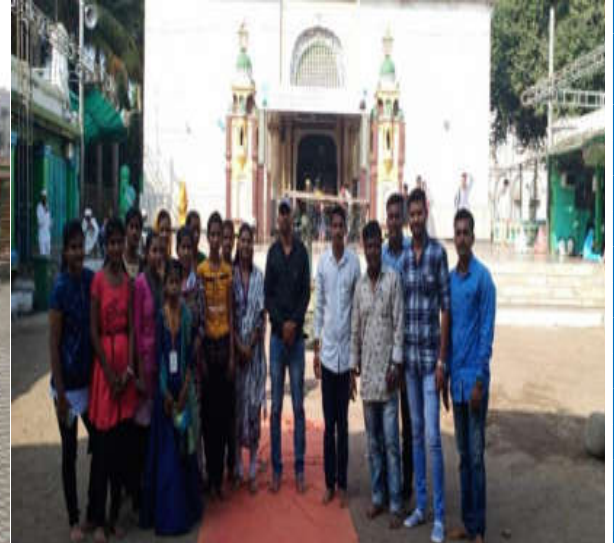
Mirasab Dargah, Miraj