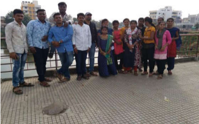
Ganapati Ghat, Miraj

Narasimhawadi is famous for the Hindu temple of Shri Narasimha Saraswati (1378–1458) located on the banks of the river Krishna. Shri Dattatreya in his Narasimha Saraswati incarnation is believed to have lived here for as long as 12 years. The life story of Shri Narasimha Saraswati, his philosophy and related stories are described in Shri Guru Charitra. There are no images or idols here which show his presence. But there are two padukas or slippers which immortalize his great avatar. The town is known for its Basundi and Kandi pedhe. kavathachi barfi is another local delicacy. There are many small food stalls around temple premises serving hot local preparations like amboli, kat-wada, mirchi bhajiyas and fresh sugarcane juice. Lodgings is available at local brahmin houses at reasonable rate. The hosts also serve simple homemade Brahmin meals.