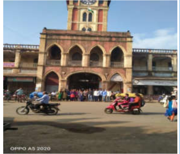
Laxmi Madai, Miraj