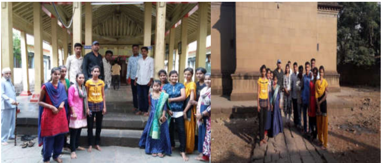
Ganesh Temple in Peshava Period

There are about a dozen inscriptions on the inside and outside of this temple, out of which only a couple of inscriptions are in good condition now. These inscriptions reveal names of few kings and their officers. All these inscriptions except one are in Kannada language and script. The only Devanagari inscription in Sanskrit language is by Singhan-II and is located on the outer wall near South entrance of the temple.