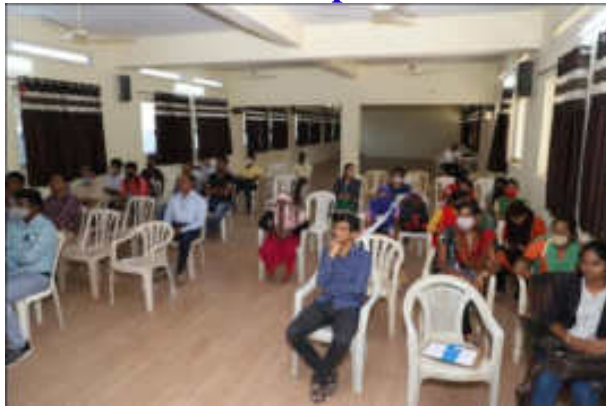
Participants in Welcome Function