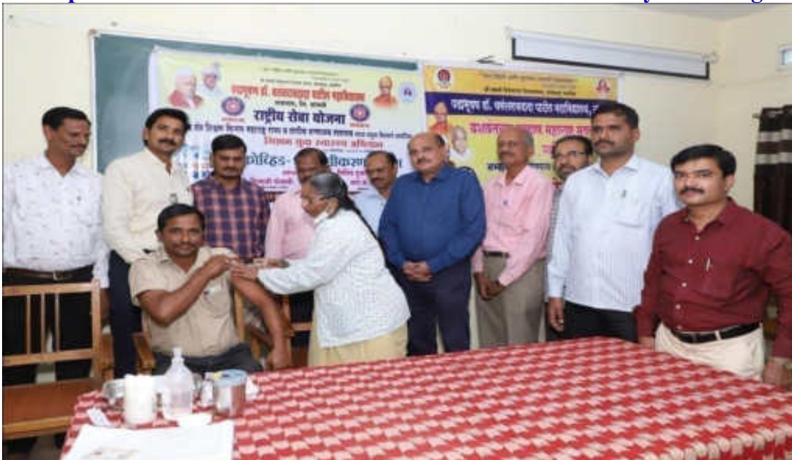
Participant Vaccinated By Sister & Principal With Staff