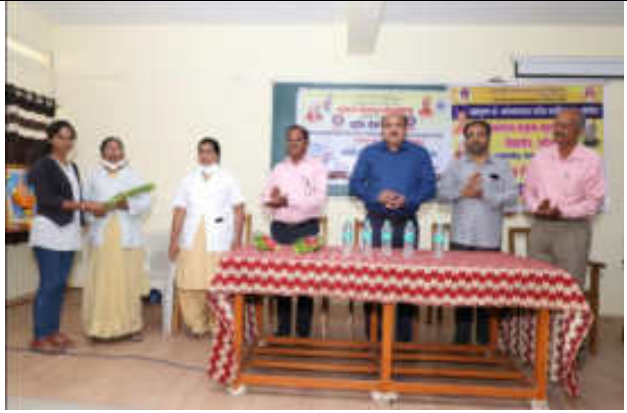
Hospital Staff Felicitated By N. S. S. Students