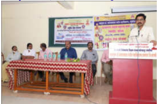
Votes of Thanks By Anna Bagal