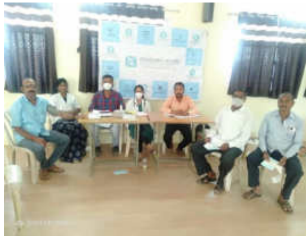
Checking of B. P. and Sugar of Participant by Team of Sevasadan Hospital Miraj with Senior Citizen