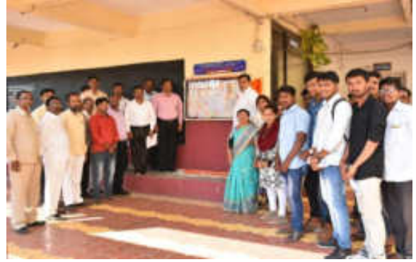
Inauguration of Wall Paper of Great Poet "Kusumaraj" in Marathi