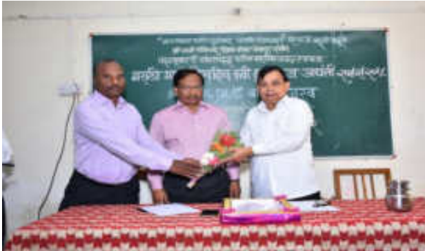
Felicitatation of Chief Guest