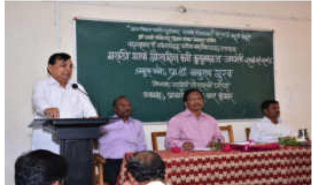
Chief Guest addressed the audience