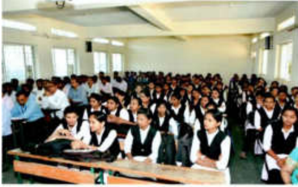
कार्यक्रमासाठी सहभागी श्रोते