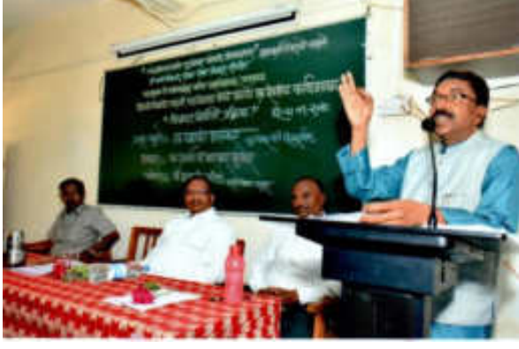
उद्घाटक व प्रमुख मार्गदर्शक