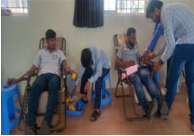
Blood donation by NSS Student