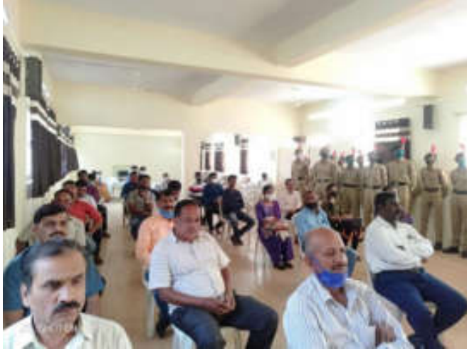
Faculties with students