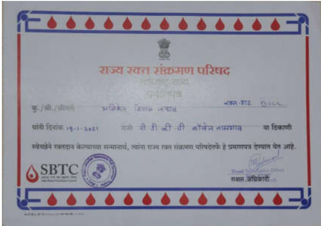
Certificates Provided By Blood Bank to Blood donated Participants