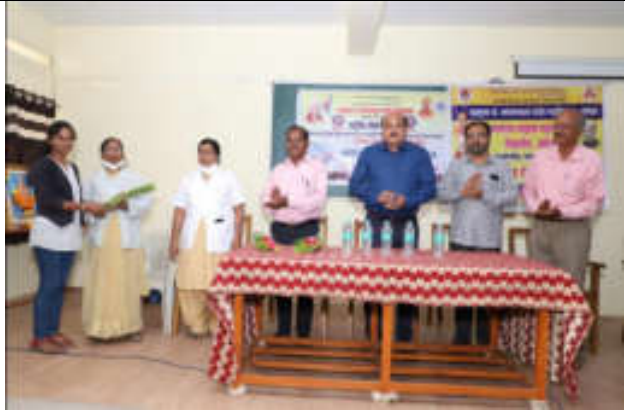
Hospital Staff Felicitated By N. S. S. Students