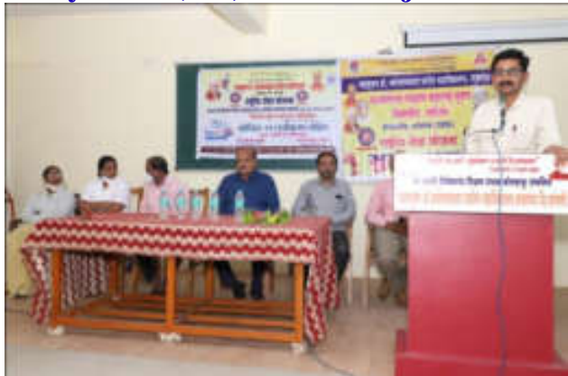
Votes of Thanks By Anna Bagal