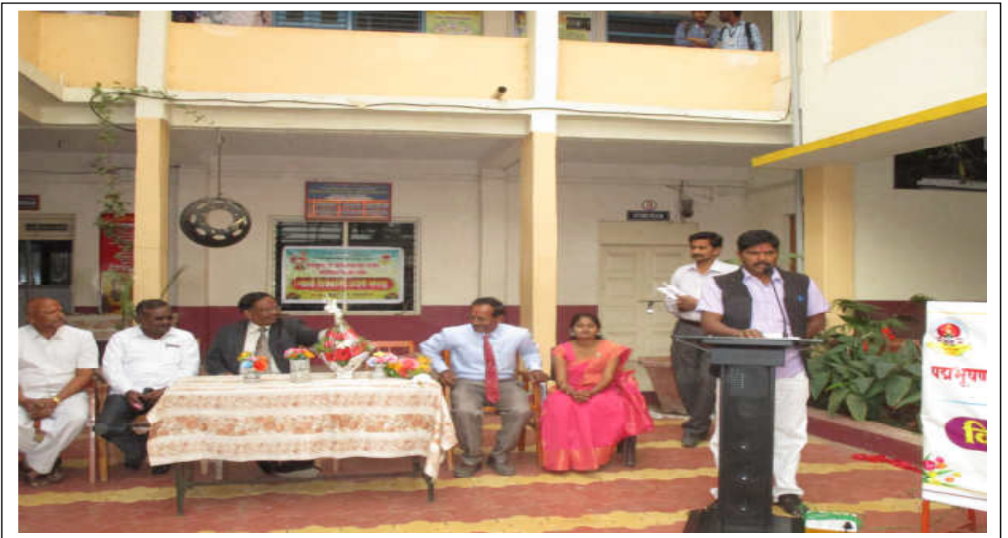
Chief Guest Hon. Pratap Edake