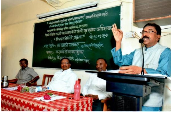
उद्घाटक व प्रमुख मार्गदर्शक