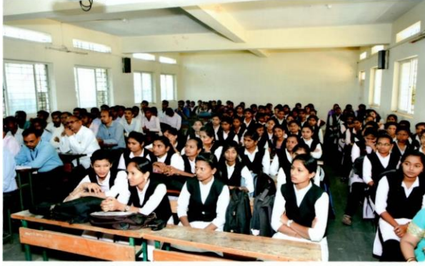
कार्यक्रमासाठी सहभागी श्रोते