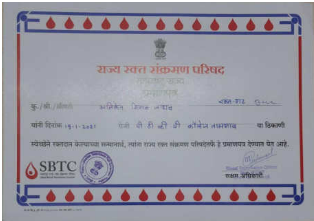
Certificates Provided By Blood Bank to Blood donated Participants