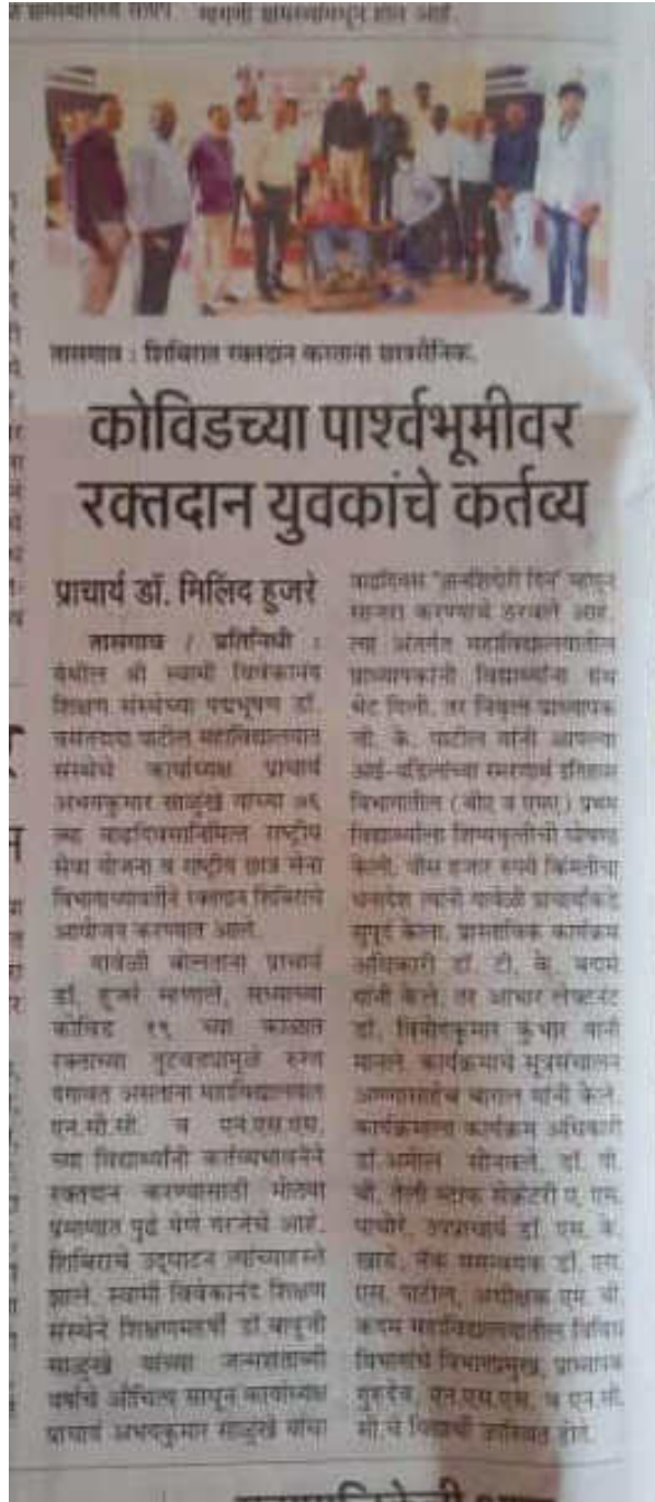
Punya Nagari - Sangli Edition Dated 20/01/2021