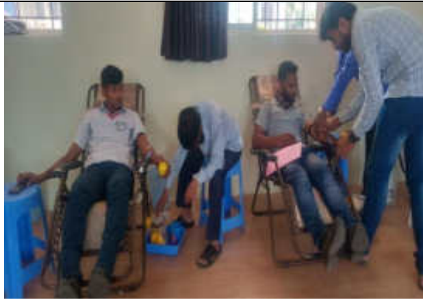
Blood donation by NSS Student