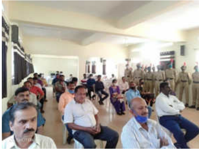
Faculties with students