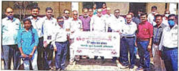
साधन : कठमेयुक्त दिवाली लम्बिपानाया वार्ध कलायना प्राप्याय ई. विंतिव हुनो व इतर निताव.

शरिफम जलिनगरी आ हाँ दी के कामने आ हाँ की लेली, आ हाँ दी की योग्यता प्रा जल्मपावत काल धरमा भूतजन्मपावती एह एसाएसा, सम्बन्धक जलिनग भाने जिला पावत, तपसीन कालने हाली काल, अमेरिका काल कीरिपन चहुँने, जेसन बाड़ी अहो तपसीन कालनो हाले