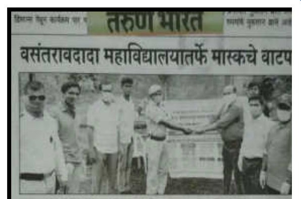
तालगान : पेचील पी. दी. जी. पी. पराविद्यालयाधेवतीचे मानवचे बाटफ बालाना प्राथार्थ हाँ विकित हुती व हता.