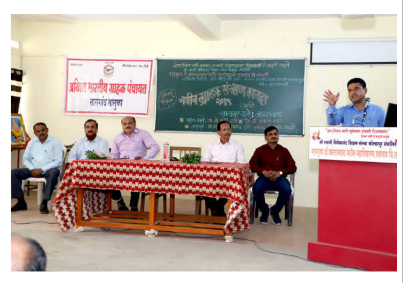
Resource Person Speech by Hon. Gajanan Kamble