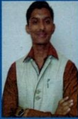
वर्धमान राजेंद्र बोथरा संपादन सहाय्य एम.डि.भाग-१